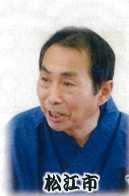
松江市 楽生亭楽笑