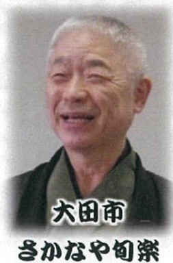
大田市 さかなや旬楽