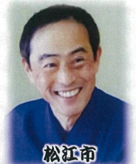
松江市 笑皆亭笑極

日時 12月13日(日) 13時開場 13時30分開演 会場 サンレディー大田 ふねあいホール 定員 245名(予定) ☎ 0854(82)6700